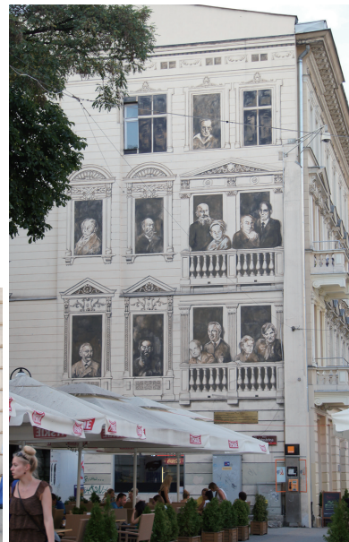
街の至る所にパブリックアートが

また、ウッチの文化を形成した4つの文化、ポーランド、ロシア、ドイツ、ユダヤのそれぞれの文化を体験できる「4つの文化フェスティバル」(毎年5月)も人気。