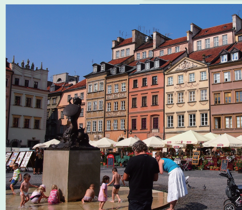
ワルシャワ歴史地区

成田から直行便が就航し、ノンストップでアクセスできるようになった首都ワルシャワ。ポーランドへのゲートウェイとしてだけでなく、第二次世界大戦後の攻撃で破壊された街並みを忠実に再現したことで世界遺産に指定された歴史地区をはじめ、音楽家ショパンゆかりの地が数多く点在するなど、見どころが充実。空港から中心部へも近いので、到着後、すぐに街の雰囲気を体感できるのも魅力だ。