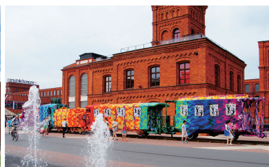
複合施設「マヌファクトゥーラ」

工業都市として繁栄を極めたウッチ。今、当時の工場や倉庫、ポーランド全土から集まった労働者たちが住んでいた集合住宅がリノベーションを経て、当時の雰囲気をそのままに、ポーランドでも屈指のトレンド・スポットに生まれ変わっている。