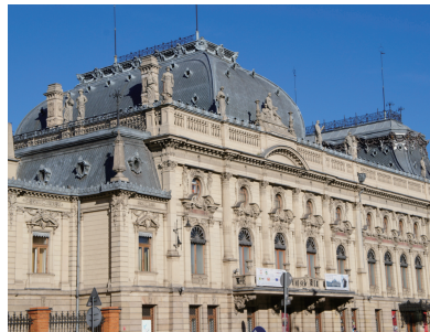
ポズナンスキ宮殿

町の中心部にあるウッチ市博物館は、この地で活躍したユダヤ系大資本家ポズナンスキ家の邸宅。「ポズナンスキ宮殿」と呼ばれたほどの大邸宅で、当時の繁栄ぶりに思わずため息が出るほど。19世紀の建物で、フレンチ・ルネサンス様式の外観に、内部はネオ・バロック様式の重厚なインテリア、ユダヤ風の模様や19世紀末から20世紀初頭にかけて流行した優美なアールヌーヴォー様式のデザインも取り入れている。