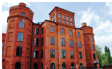
旧工場を利用した高級マンションも

集合住宅は、おしゃれなレストランやカフェ、ショップやギャラリーに変身。どこか懐かしレトロで、また昔の社会主義時代を感じさせる異次元な雰囲気が今や新しい魅力となって、若者を中心に幅広く人気を集めている。